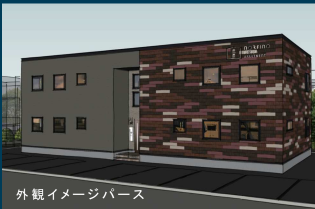
外観イメージパース