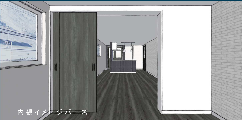
内観イメージパース